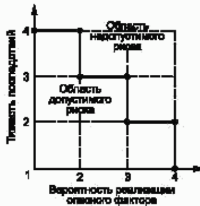
Рисунок Б.1 — Диаграмма анализа рисков

Если точка лежит на или выше границы — фактор учитывают, если ниже — не учитывают.